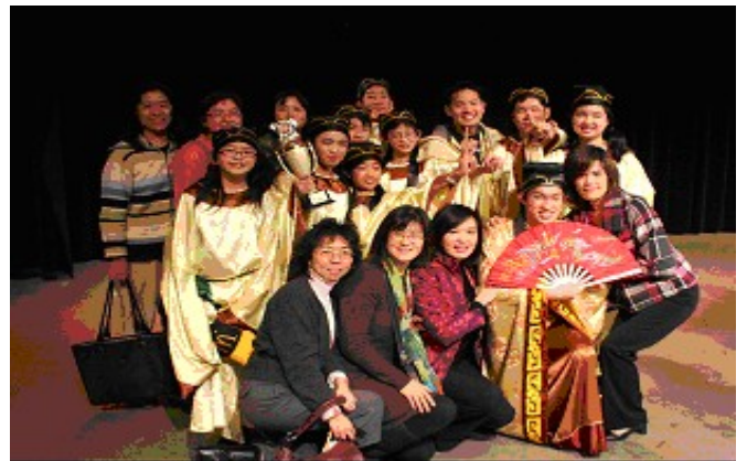
本校演獎班同學於「北加州 2009 短劇/小品大賽」奪得冠軍

本校於 12/19/09 參加由華藝表演藝術中心所主辦的「北加州 2009 短劇/小品大賽」，榮獲青少年組第一名。這項活動競爭非常激烈，本校演講班同學在林珀平老師的指導帶領下出賽。經過評審委員和全體現場觀眾的票選，演講班同學以「老夫子學院」一劇奪得冠軍，除獲贈獎金五百元外，並將受邀至世界電視台錄影並公開播放，同時也會於本校 3 月 6 日舉辦的新春聯歡會上表演，屆時歡迎全校家長前來觀賞。