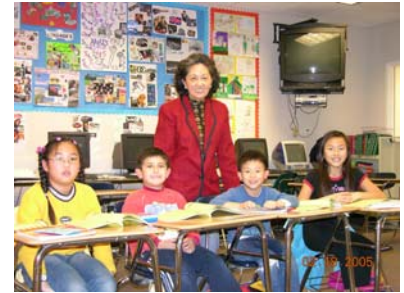
譚老師與漢語拼音班四位小朋友

下學年招生即將開始，思源本著推廣中文教育，服務所有華僑的精神，繼續招收漢語拼音班的學生，希望這支小樹苗能日益茁壯。